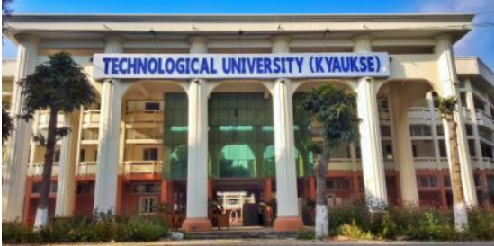
ပုံ(၁) နည်းပညာတက္ကသိုလ်(ကျောက်ဆည်)

ဇယားနှင့် ပုံများသည် Centered Alignment ဖြစ်ရပါမည်။ ကော်လံ တစ်ခုထက်ကျော်လွန်သော ဇယား (သို့) ပုံဖြစ်ပါက စာမျက်နှာ၏ ထိပ် (သို့) အောက်ဘက် နေရာတွင်သာ ထားရှိရပါမည်။