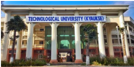
Figure 1. Figure Headings below the Figure

Figures and tables must be centered in the column. Large figures and tables may span across both columns. Any table or figure that takes up more than 1 column width must be positioned either at the top or at the bottom of the page.